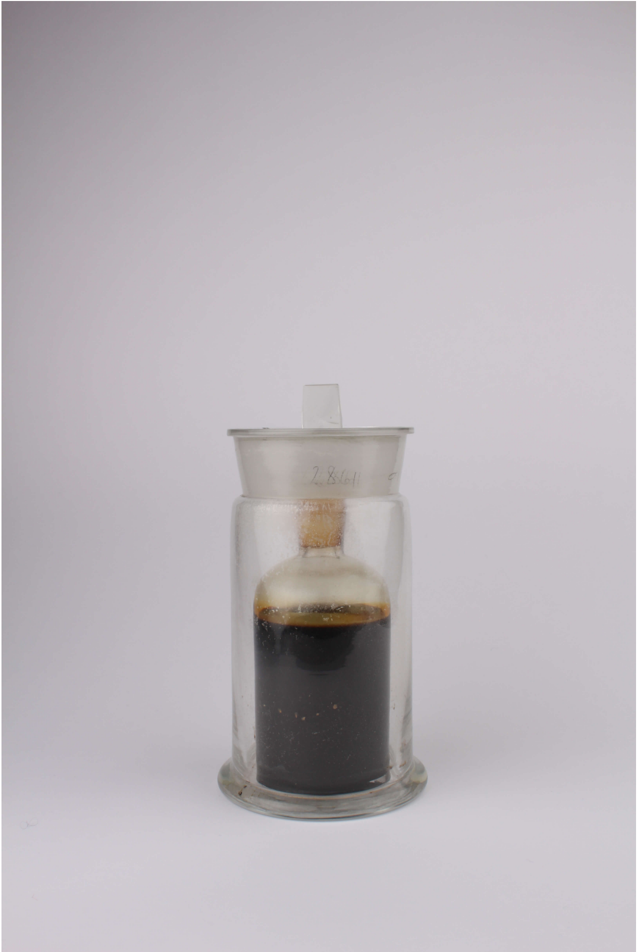
Fig. 1. Myroxylon balsamum var. pereirae - Resin - FS 2861.